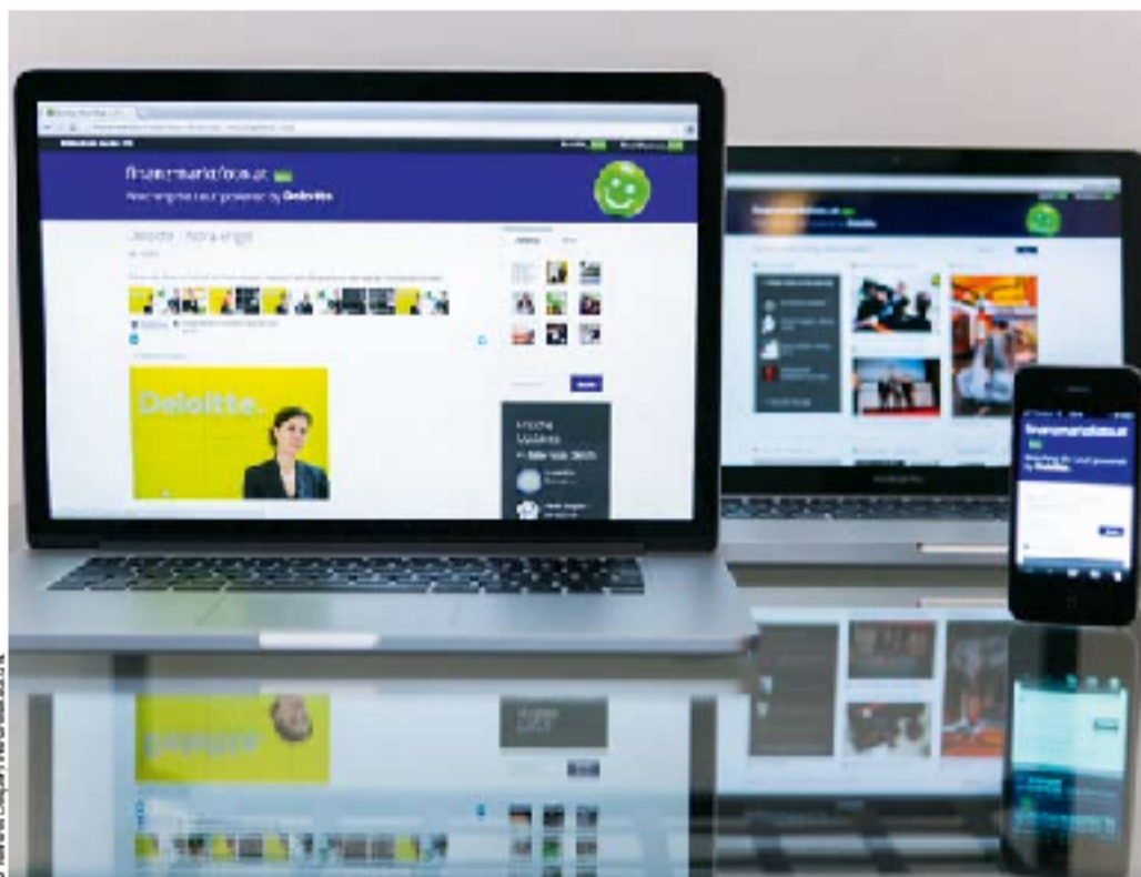
Viele Wege und Endgeräte führen zu finanzmarktfoto.at. Bleibt nur gleich vom Start weg der RSS-Feed http://finanzmarktfoto.at/feed/pics

Web 2: Die Beta-Version einer auf Finanzfotos spezialisierten Site ist seit 12.12.12 online.