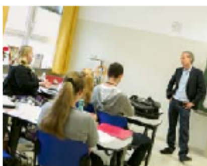
v.o.u.: Die Vienna Business School in Wien Floridsdorf.