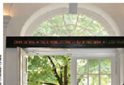
Jahrelang gab es nur einen offiziellen Kursticker, jenen der Wiener Börse. Institutionellen ist das aber zunehmend egal, sie weichen „ausserbörslich“ aus.

Die Dark Pools als Nutzniesser: Wenn es keine Privatanleger mehr an der Börse gibt, weichen die Profis verstärkt auf ausserbörsliche Plattformen aus. Und die Trader traden DAX-Titel.